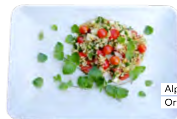
Alpines trifft Orientalisches

Einst galten Bergminzen wie Thymian, Salbei oder Ysop als überaus geschätzte Heilpflanzen, mit denen sich so gut wie alle Krankheiten vertreiben lassen sollten. Als förderlich für die Verdauung, lindernd bei Magenbeschwerden, ausgleichend bei Nervosität und Stress, stärkend für die Lunge und abwehrend gegen Infektionen gelten