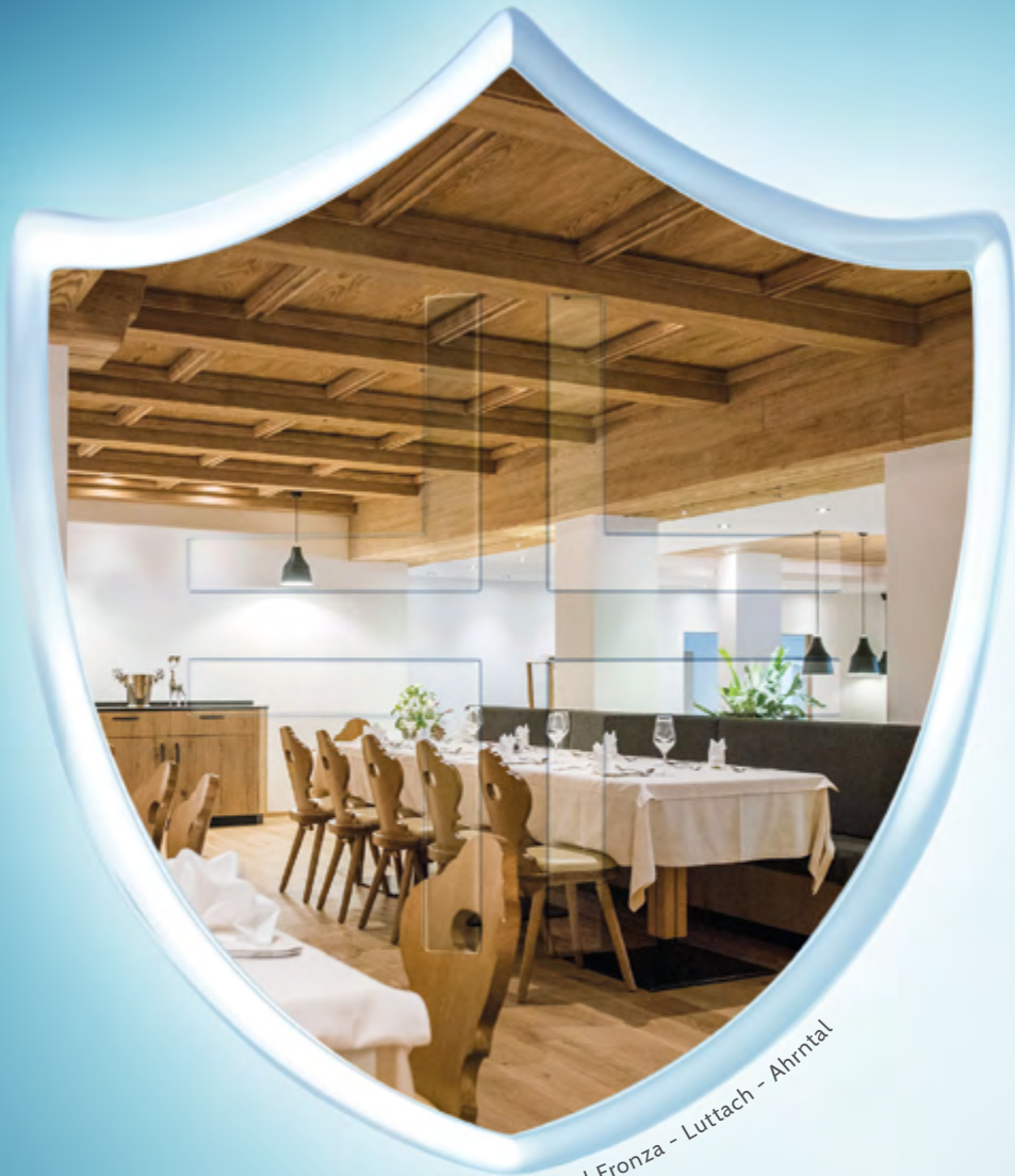
Hotel Fronza - Lutlach - Ahntal