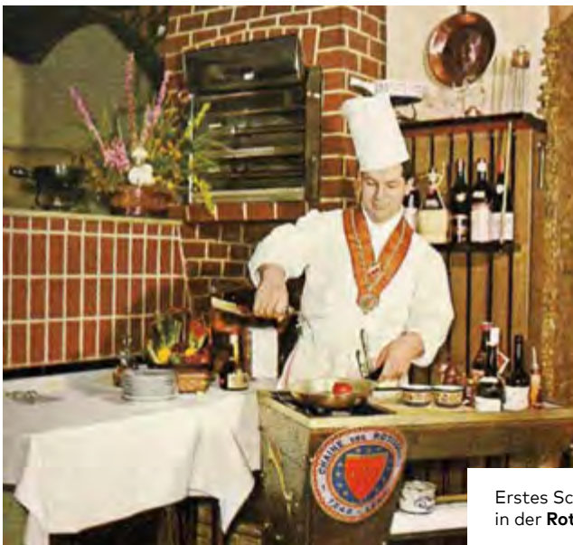
Erstes Schaukochen in der Rotisserie Andrea