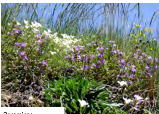
Bergminze Acinos alpinus

Unter dem Namen Bergminze firmieren gleich mehrere Pflanzenarten. Der Alpen-Steinquendel ( Acinos alpinus ), auch Bergbasilie, Steinpoley, Bergthymian oder Alpen-Saturei genannt, überzieht oft Felskanten oder steinige Hänge mit seinen Polstern, die violette Blüten tragen. Er duftet würzig nach Pfefferminze, Thymian und Bohnenkraut, schmeckt pfeffrig-würzig. Man findet ihn