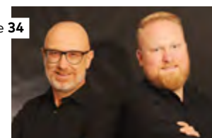
Die besten Südtiroler Restaurants und Winzer prämiert